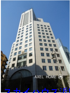
スカイハウス浜離宮 (SKY HOUSE HAMARIKYU)