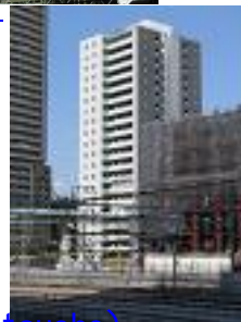
ホワイトタワー浜松町 (White Tower Hamamatsucho)