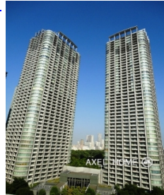
ラ・トゥール汐留 (La Tour Shiodome)