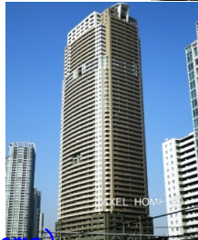
スカイグランデ汐留 (SKY GRANDE shiodome)